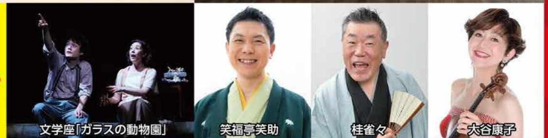
文学座「ガラスの動物園」