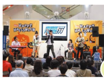
優勝すると Ario八尾で ライブ