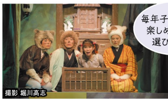
うすもも色時間~さっちゃんの大冒険~ (H25)