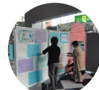
市民が稽古場をサポートしました