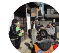
八尾のおはなし・まちあるき (H24)