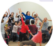
今日からあなたもダンサー! いっぱい踊りたい人集合!