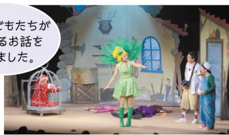
おどろぼうホツエンプロッツ (H26)