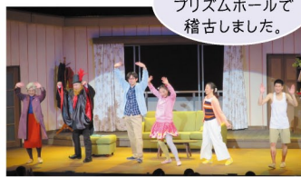
鏡の中の秘密の池 (H27)