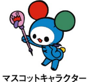
マスコットキャラクター 「ポロンちゃん」