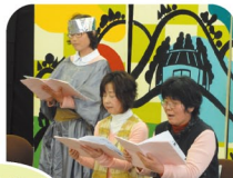
今も地域で 大活躍