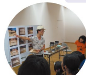
高安の木で楽器をつくらう!