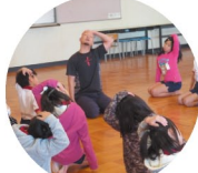
八尾市内小学校アウトリーチ 大駱駝艦の舞踏を体験しよう!