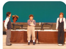
元気印の演劇たち