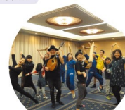
公演テーマダンスをつくらう ~ダンス×音楽~