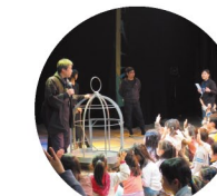
バックステージツアー (H26)