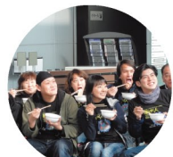
ぶらっとプリズム: もちつき参加 (H23)

稽古から本番まで1ヶ月以上にわたり滞在して作品をつくります。その機会を活かして出演者と市民が交流を深めました。