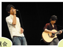
プロによる バンドクリニック