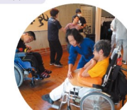
ホボロの会 里の風ワークショップ