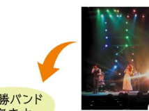
優勝バンド 審査中