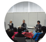
俳優さんの本の朗読を 聞いてみよう (H27)