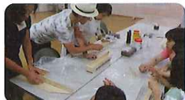
高安の木で楽器をつくらう！