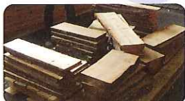
製材されてきれいな木材に