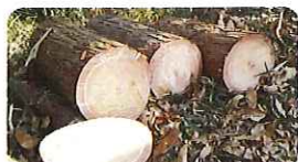
伐採したてのヒノキ材

今回は、ニッポンバラナタゴ高安研究会から提供していただいた八尾・高安山で育ったヒノキとクヌギが楽器になって舞台上に登場します。山の上から八尾を見守り続けてきた木々たちが奏でるのは歌い継がれてきたふるさと八尾の「わらべうた」や、昔からこの地で人々が織り成してきたできごとをイメージしたオリジナル曲。それらの音楽にのせて八尾でいろいろなものを創りだして来た人々の美しい姿を思いながら踊ります。