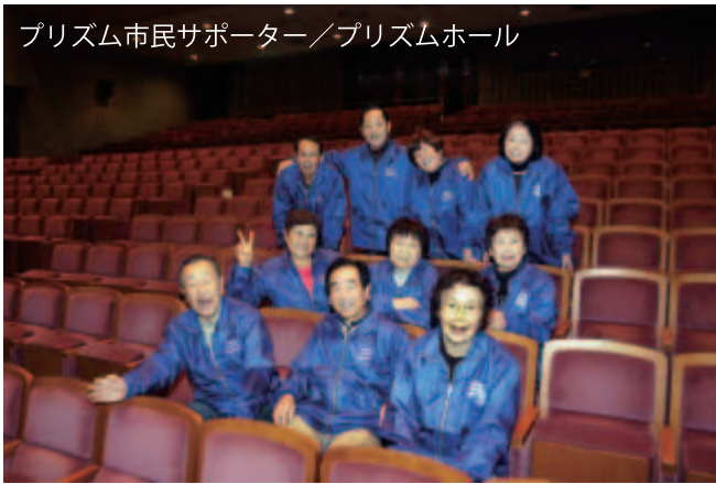
プリズム市民サポーター／プリズムホール

八尾の写真家・山田哲生 てっせい さんが八尾の元気な文化 団体・サークルのみなさんを、プリズムホールの 各所で撮影。個性と魅力あふれる瞬間をとらえた 写真展です。総勢400名のモデルのみなさんの キラキラと輝く笑顔に会いにお越しください。