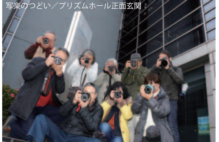
写楽のつどい／プリズムホール正面玄関